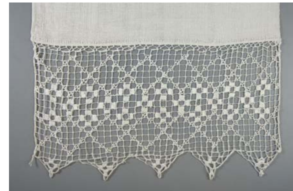
Del af kisteklæde udstillet i en af glasmontrerne.

- hvide bondebroderier på Holbæk Museum 2009